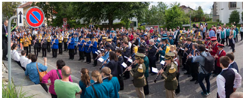
Die am Flashmob teilnehmenden Musikanten bei der anschliessenden Tonaufnahme.