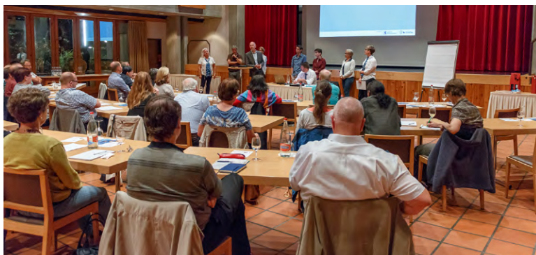
Angeregte Diskussionen an der Fachtagung Jugend 2016

3. Fachtagung Jugend, 27.9.2017 zu den Themen «Netzwerk-Jugend-Musik-Schule»! Die Stadtjugendmusik Kloten ist Gastgeberin, lädt uns nach Bassersdorf ein und schafft so den Rahmen zu Info und Austausch unter den verschiedenen Beteiligten. Nehmen Sie die Gelegenheit wahr, auch Ihr Netzwerk zu erweitern, Kontakte zu knüpfen, sich auszutauschen und Neues zu erfahren. Ein gutes Netzwerk ist in jeder Gemeinde, in jeder Region, in unserem Kanton von eminenter Wichtigkeit, um im Thema «Nachwuchsförderung» weiterzukommen. Wir freuen uns auf Sie!