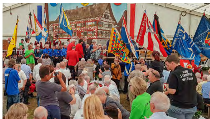
Veteranenehrung am Veteranentag 2018 in Marthalen