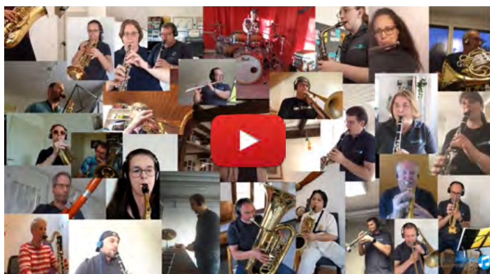
Stadtmusik Illnau-Effretikon mit einem Daft Punk Medley

Umso mehr hat es uns aber gefreut, dass kurz vor Versand des Newsletters noch zwei Beiträge von der Stadtmusik Illnau-Effretikon und der Musikgesellschaft Andelfingen eingegangen sind. Und diese möchten wir euch nun nicht vorenthalten (ein Klick auf eines der Bilder öffnet das Video auf YouTube):