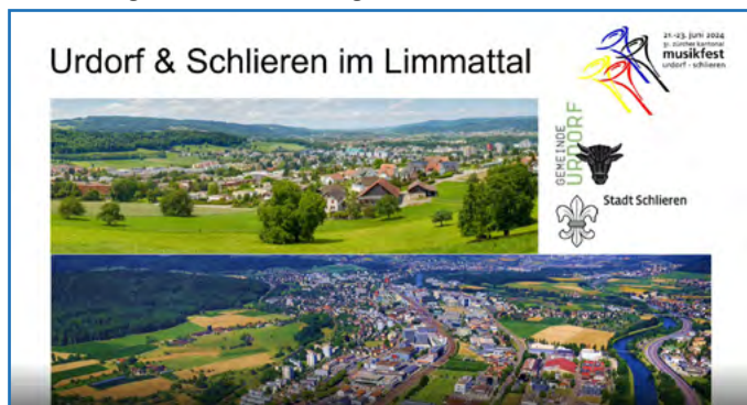
Das Vorstellungsvideo der sich für die Durchführung des Kantonalen Musikfestes 2024 bewerbenden Vereine aus Urdorf und Schlieren weckt bereits jetzt Vorfreude und Lust auf die Teilnahme