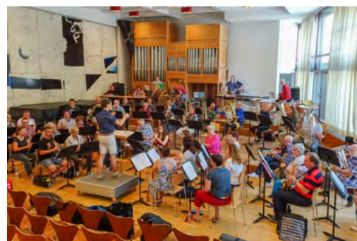
Sehr geschätzt werden die Proben mit dem Ad-hoc Orchester.

Wie bereits im letzten Newsletter berichtet, mussten wir bei den aktuellen Dirigierkursen 2019/2020 einige Termine absagen und so auch die Abschlussprüfung verschieben. Dank der grossen Unterstützung von vielen Musikerinnen und Musikern des Ad-hoc Orchesters, von Vereinen, flexiblen Teilnehmenden und Kursleitern und nicht zuletzt der Militärmusik, sieht es momentan so aus, als könnten wir den ausgefallenen Unterricht sowie die Abschlussprüfung vollständig nachholen. Letztere ist nun auf den 26. August angesetzt und wird in Suhr und mit dem RS-Spiel als Prüfungsortchester durchgeführt. Wir sind dankbar für diese Unterstützung und freuen uns, unsere aktuellen Teilnehmenden durch diese tolle Gelegenheit zumindest ein wenig für die Turbulenzen entschädigen zu können.