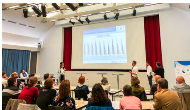
Interessante Inputs und angeregte Diskussionen an der letztjährigen Fachtagung Jugend