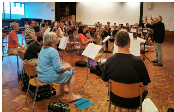
Fotos: Probe vom 9. Juni 2020 im Gemeindesaal Bonstetten