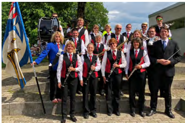
Der MVB am Zürcher Unterländer Musiktag 2018

So wird also der MVB still und leise von der Bildfläche verschwinden, ohne die Möglichkeit gehabt zu haben, sich musikalisch in der Öffentlichkeit von seinen Freunden, Fans, Passivmitgliedern, Gönnern und Sponsoren zu verabschieden und sich für das während Jahrzehnten genossene Wohlwollen und die Unterstützung von Behörden, Vereinen und Gewerbe zu bedanken. Das bedauern wir zutiefst, denn auch für uns ist das die traurigste Art, die 90-jährige Geschichte des traditionellen Dorfvereins zu beenden.