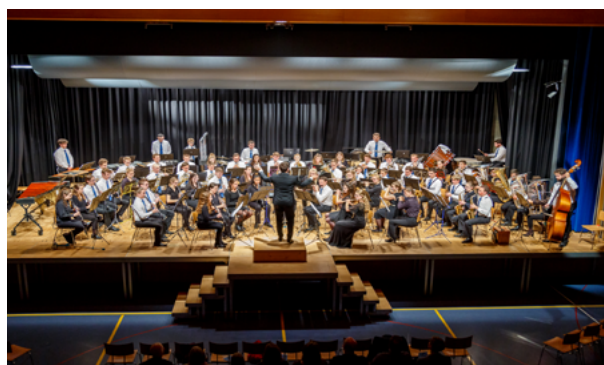
Abschlusskonzert des diesjährigen JBO u25 in Stein am Rhein