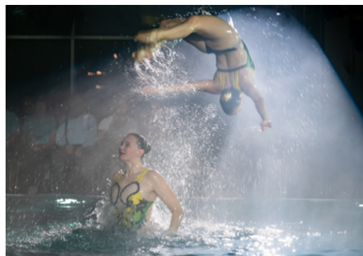
Auch spektakuläre Sprünge gehören zum Repertoire der Limmat-Nixen Zürich.

Während der Verein sich am Dienstag eine Verschnaufpause gönnen durfte, waren Regie und Technik auch an diesem Abend wieder zu Gange und programmierten die gesamte Lichtshow. Die letzte Chance um Fehler auszumerzen und gleichzeitig zum ersten Mal die ganze Show ohne Unterbruch durchzuspielen folgte dann am Mittwoch in der Generalprobe.