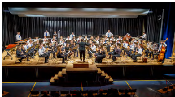
Abschlusskonzert des diesjährigen JBO u25 in Stein am Rhein