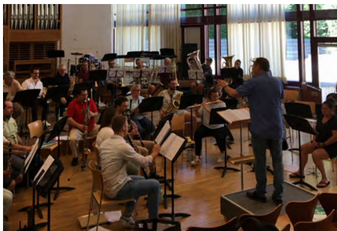
Das Ad-Hoc Orchester war bis zur letzten Minute konzentriert.