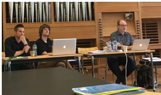
Kursleiter und Experte beobachten konzentriert.