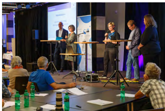
Podiumsdiskussion an der letztjährigen Fachtagung Jugend