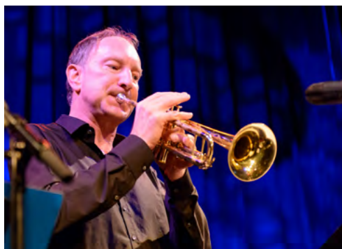
Daniel Schenker Workshop Improvisation für Blasinstrumente